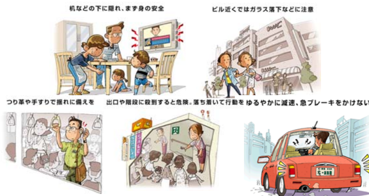
緊急地震速報を見聞きしたら...?